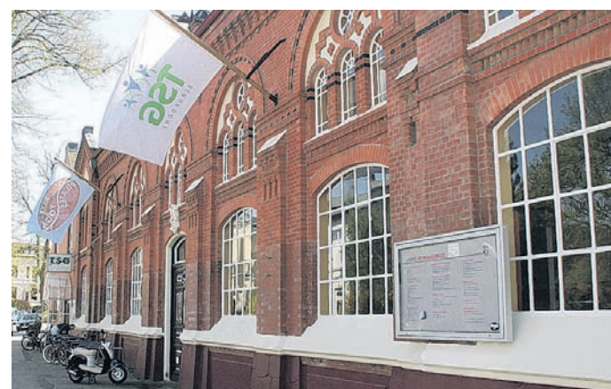
Hier absolvierten viele Bergedorfer ihre erste Turnstunde: Die Sporthalle Bult stammt aus dem Jahr 1896.