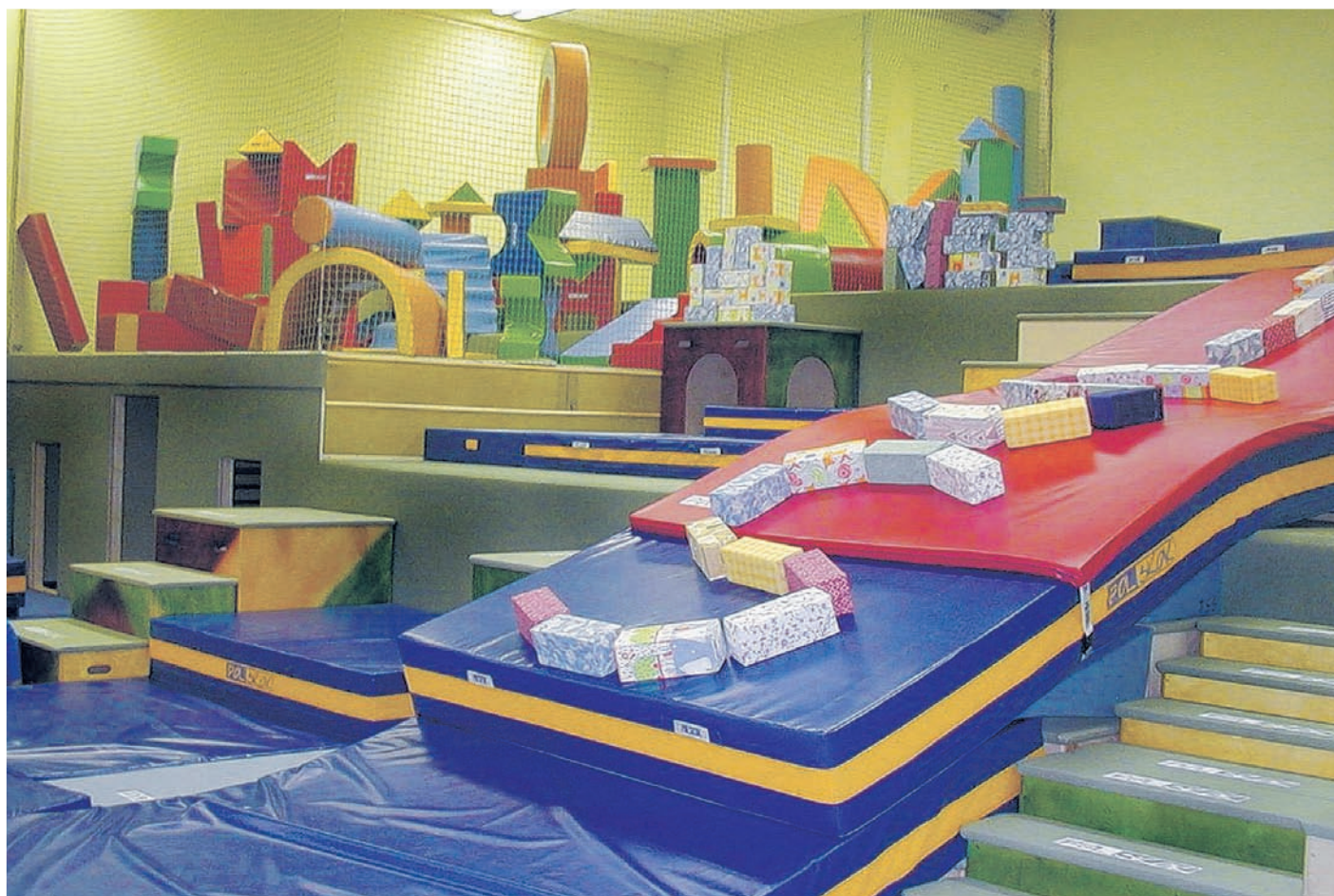
Im kissland (Kindersportschulland) in Wentorf befindet sich eine 250 Quadratmeter große Bewegungslandschaft für Kinder, die hier nach Belieben toben und spielen können.

Zahlreiche Fotos von unserer Veranstaltungen sind auf der TSG-Homepage unter www.tsg-bergedorf.de zu sehen. Dort finden Sie auch weitere Informationen zum Jugendfußball in der TSG Bergedorf.