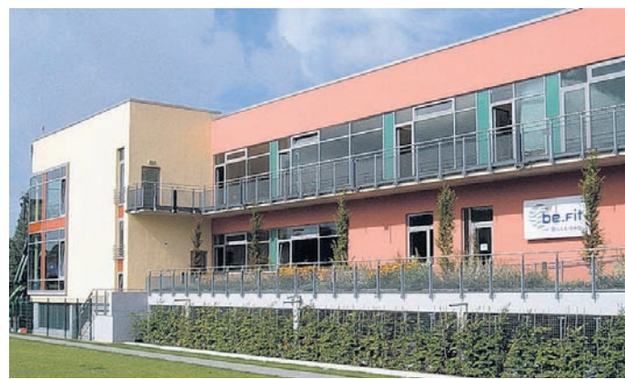
Im 2005 eröffneten be.Fit im Bille-Bad ist ein modernes Fitness-Studio integriert.

Von der klassischen Gymnastik, Reha- und Präventionssport, über zahlreiche Aerobic- und Tanzangebote, bis hin zum Kindersport von ein bis sechs Jahren, steht hier ein Angebot für die ganze Familie, für jüngere und ältere Menschen bereit. Im September 2007 eröffnete im TSG Sportzentrum am Bult das Yoga- und Pilates Zentrum Hamburg, dessen umfangreiches Angebot aus den Bereichen Yoga, Pilates, Qigong und Meditation sich großer Beliebtheit erfreut und schon nach kurzer Zeit weit über die Grenzen Bergedorfs hinaus