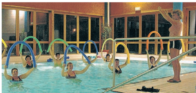
Wassergymnastik ist besonders für ältere Menschen geeignet und schont den Gelenkapparat.

■ Ausführliche Informationen zum Sportangebot der TSG Bergedorf finden sie im Internet unter www.tsg-bergedorf.de . Oder rufen Sie uns an unter der Telefonnummer (040) 725 495 - 0 an.