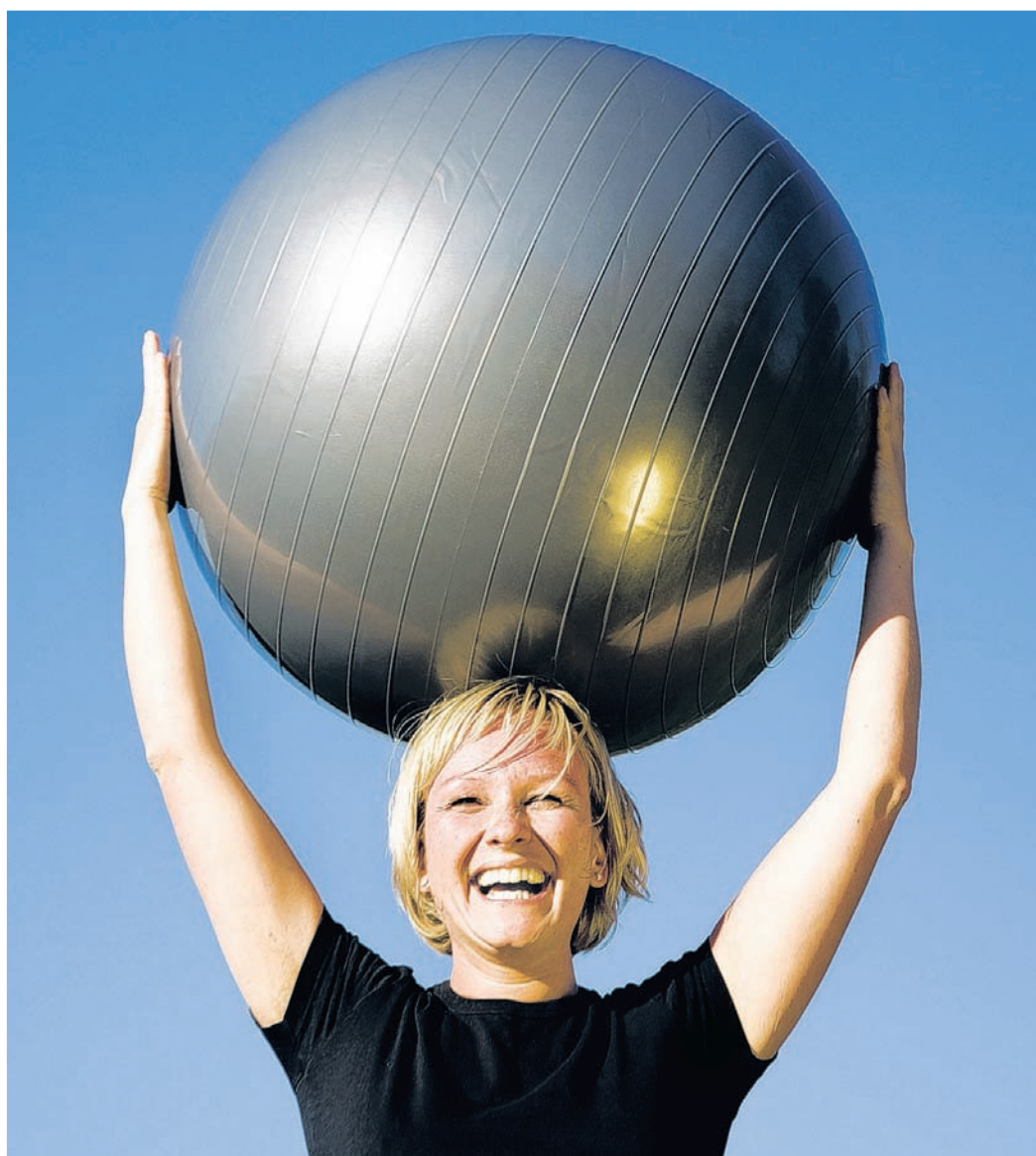
Mit den Präventionskursen der TSG Bergedorf stärken Sie Ihr körperliches Wohlbefinden.

Durch sportliche Gruppen-Therapien oder funktionelles Krafttraining werden Ausdauer, Koordination, Flexibilität und Kraft aufgebaut und verbessert. Durch die Steigerung der körperlichen Leistungsfähigkeit wird damit das körperliche und geistige Wohlbefinden gesteigert. Rehasport-Gruppen unterliegen hohen Qualitätsanforderungen und werden in der TSG Bergedorf von Diplom-Sportwissenschaftlern und qualifizierten Fach Übungsleitern durchgeführt.