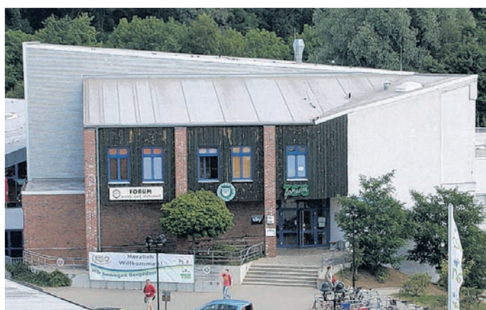
Das TSG Sportforum ist die größte vereinseigene multifunktionale Sportanlage Norddeutschlands.

►be.Fit im Bille-Bad, Reetwerder 25, 21029 Hamburg, Telefon: (040) 707 03 866. E-Mail: be.fit@tsg-bergedorf.de .