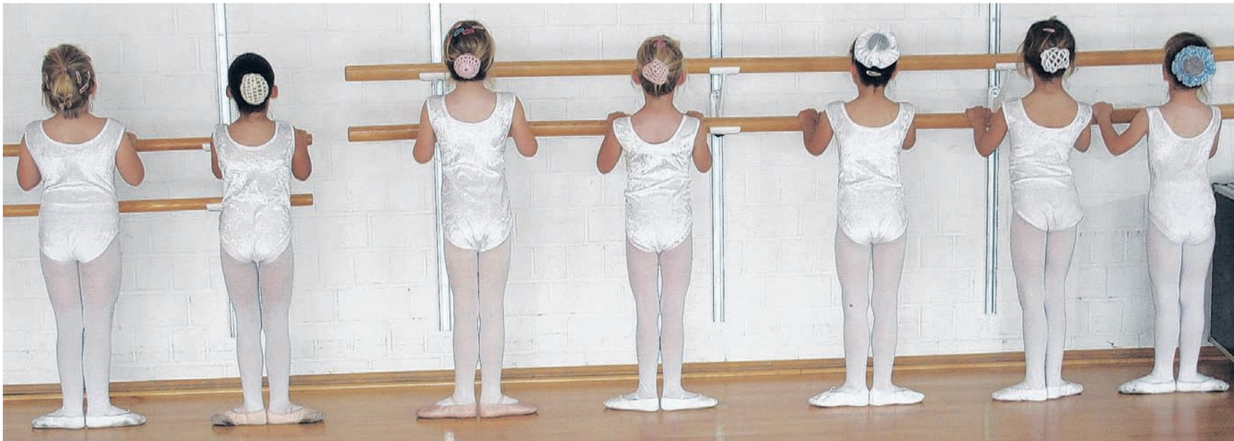
Bei der TSG Bergedorf werden Kinder ab vier Jahren spielerisch an das klassische Ballett herangeführt.